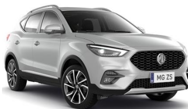
MONUMENT светло сива