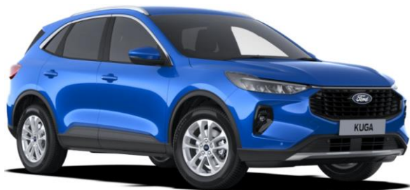
DESERT ISLAND BLUE