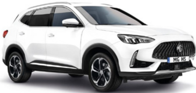
DOVER WHITE- бела