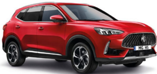
DIAMOND – црвена (COMFORT)