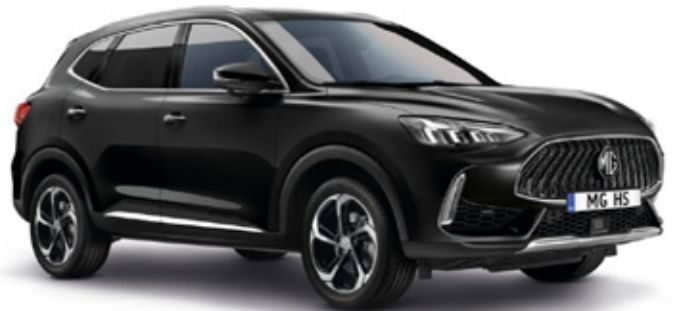
PEBBLE - црна