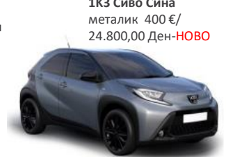
1K3 Сиво Сина металик 400 €/ 24.800,00 Ден- НОВО