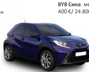
8Y8 Сина металик 400 € / 24.800,00 Ден