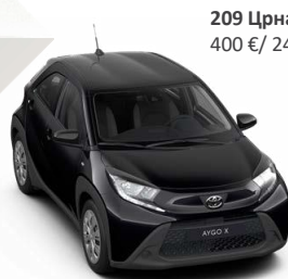
209 Црна металик 400 € / 24.800,00 Ден